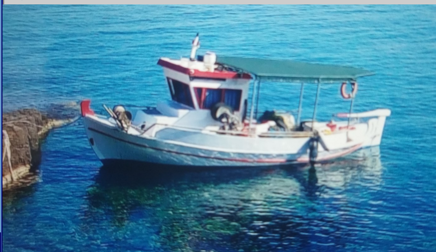
Το Α/Κ "NTINA"

Η διεξαγωγή της τεχνικής διερεύνησης δεν επιδιώκει την απόδοση ή τον επιμερισμό ευθύνης ή υπαιτιότητας. Έχει αποκλειστικό σκοπό, μέσω της διαδικασίας της ανάλυσης, τον προσδιορισμό των συντελεστικών παραγόντων και αιτιών που οδήγησαν σε ένα ναυτικό ατύχημα, την εξαγωγή χρήσιμων συμπερασμάτων και διδαγμάτων και την υποβολή συστάσεων ασφαλείας ή προτάσεων προς τα εμπλεκόμενα με το ναυτικό ατύχημα μέρη, με απώτερο στόχο την πρόληψη ή αποφυγή παρόμοιων ναυτικών ατυχημάτων στο μέλλον.