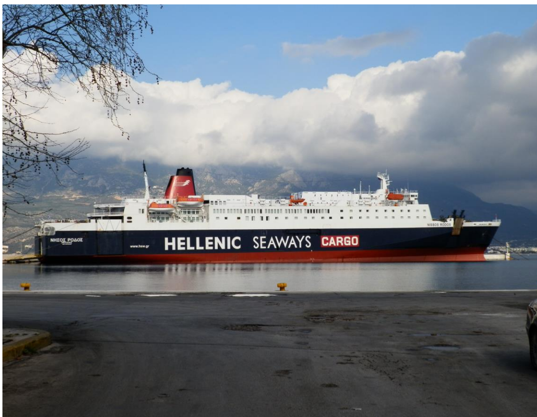
Εικόνα 1: Το Ε/Γ-Ο/Γ «ΝΗΣΟΣ ΡΟΔΟΣ» παραβελημένο στο λιμένα της Κορίνθου