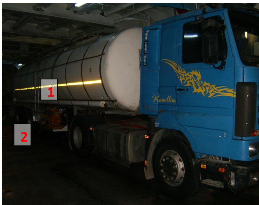
Εικόνα 4: Το βυτιοφόρο όχημα σταθμευμένο στο σημείο υδροδότησης, στο γκαράζ του Ε/Γ-Ο/Γ «ΝΗΣΟΣ ΡΟΔΟΣ». Διακρίνεται η πλευρική δεξιά κλίμακα του βυτίου (1) και το σημείο όπου βρέθηκε ο τραυματίας (2).

Ο θόρυβος από την πτώση, έγινε αντιληπτός πρώτα από το Ναύκληρο, ο οποίος έσπευσε στη δεξιά πλευρά του βυτίου και είδε τον τραυματισμένο σε ύπτια θέση κάτω ακριβώς από την κλίμακα, με το κεφάλι του προς το βυτίο. Το περιστατικό έγινε αντιληπτό σχεδόν άμεσα και από τον οδηγό, ο οποίος βρισκόταν στην οροφή των δεξαμενών.