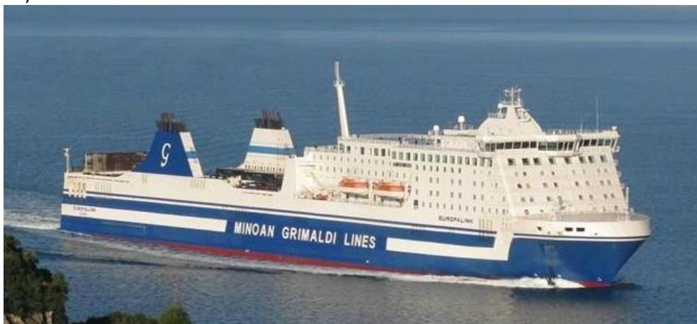
Το Ε/Γ-Ο/Γ EUROPALINK.

προέβλεπε τη διέλευσή του από το στενό μεταξύ της Κέρκυρας και της νησίδας Περιστερές, αυτό δεν ακολουθήθηκε ακριβώς όπως είχε σχεδιασθεί, εξ' αιτίας της παρουσίας ενός Ιστιοφόρου σκάφους που έπλεε αριστερά πλώραθεν του EUROPALINK, που εμπόδιζε μερικώς την έγκαιρη στροφή του προς αριστερά, η οποία έλαβε χώρα μετά από το προκαθορισμένο Σημείο Ελέγχου Πορείας ("Waypoint").