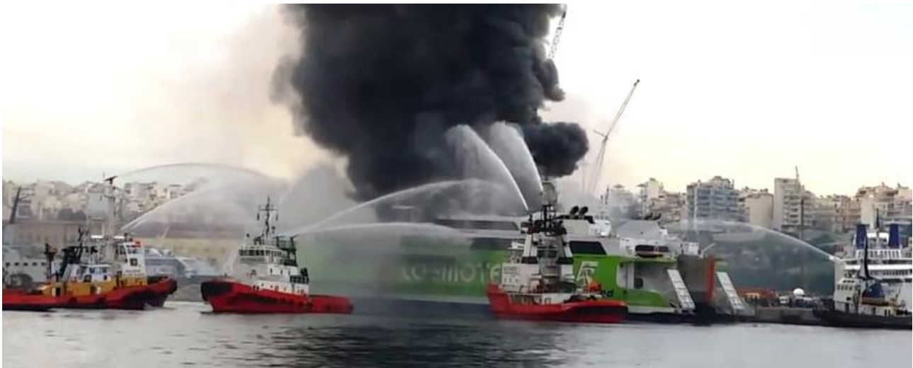
Εικόνα 1: Η κινητοποίηση των ιδιωτικών Ρ/Κ-Ν/Γ και των σκαφών της Π.Υ. για την κατάσβεση της πυρκαγιάς ήταν άμεση.

Η σχετική εντολή εγκατάλειψης δόθηκε από τον Πλοίαρχο μέσω του συστήματος μεγαφωνικής αναγγελίας. Στο μεταξύ, στην περιοχή του συμβάντος είχαν καταπλεύσει ιδιωτικά Ρ/Κ-Ν/Γ πλοία, τα οποία βρίσκονταν στην ευρύτερη περιοχή του λιμένα Πειραιά και επιχειρούσαν κάνοντας ρίψη ύδατος και αφρού πυρόσβεσης με τα μέσα που διέθεταν, από την πλευρά της θάλασσας, δηλαδή την αριστερή πλευρά του πλοίου. Συνολικά 13 ιδιωτικά Ρ/Κ-Ν/Γ σκάφη έσπευσαν στην περιοχή και ανέλαβαν δράση για την κατάσβεση της πυρκαγιάς καθώς και 02 Πυροσβεστικά πλοία του Πυροσβεστικού Σώματος. Επιπρόσθετα, εποχούμενα κλιμάκια της Πυροσβεστικής Υπηρεσίας αναπτύχθηκαν σε πολύ σύντομο χρονικό διάστημα από την πλευρά της προβλήτας, δηλαδή από τη δεξιά πλευρά του πλοίου και έκαναν ρίψη ύδατος με χρήση των αντλιών που διέθεταν τα πυροσβεστικά οχήματα και χρησιμοποιώντας την παροχή ύδατος που υπήρχε στην προβλήτα, πλησίον του πρωραίου δεξιού τμήματος του πλοίου. Τα στελέχη της Λιμενικής Αρχής Κερατσινίου έσπευσαν άμεσα και απέκλεισαν την πρόσβαση στην περιοχή του συμβάντος.