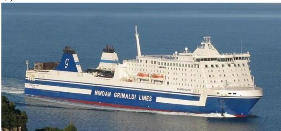
Το Ε/Γ-Ο/Γ EUROPALINK.

ακολουθήθηκε ακριβώς όπως είχε σχεδιασθεί, εξ' αιτίας της παρουσίας ενός Ιστιοφόρου σκάφους που έπλεε αριστερά πλώραθεν του EUROPALINK, που εμπόδιζε μερικώς την έγκαιρη στροφή του προς αριστερά, η οποία έλαβε χώρα μετά από το προκαθορισμένο Σημείο Ελέγχου Πορείας ("Waypoint").