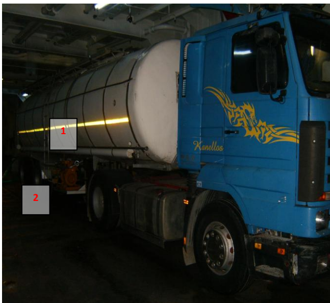
Εικόνα 2: Το βυτιοφόρο όχημα σταθμευμένο στο σημείο υδροδότησης, στο γκαράζ του Ε/Γ-Ο/Γ «ΝΗΣΟΣ ΡΟΔΟΣ». Διακρίνεται η πλευρική δεξιά κλίμακα του βυτίου (1) και το σημείο όπου βρέθηκε ο τραυματίας (2).

Ταυτόχρονα παρασχέθηκαν οι πρώτες βοήθειες στον τραυματισμένο άνδρα από το πλήρωμα του Ε/Γ-Ο/Γ και τον οδηγό του βυτιοφόρου οχήματος υπό και τις τηλεφωνικές οδηγίες ιατρού του ΕΚΑΒ μέχρι την άφιξη ασθενοφόρου, το οποίο παρέλαβε τον τραυματία και τον διακόμισε στο Γενικό Νοσοκομείο της περιοχής, όπου διαπιστώθηκε ο θάνατός του.