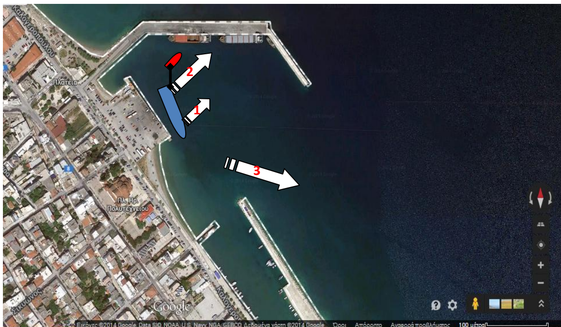
Εικόνα 2: σχεδιάγραμμα των κινήσεων τις οποίες έκανε το «JSM» (γαλάζιο σκάφος):