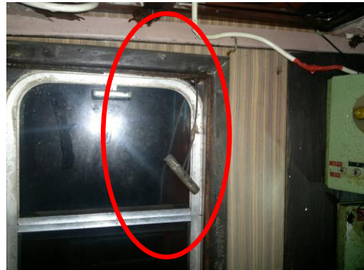
Εικόνα 4: Ο μοχλός απασφάλισης του συστήματος άμεσης απελευθέρωσης ρυμουλκίου στο χώρο πηδαλιουχίας του ΑΡΤΕΜΙΣ V.