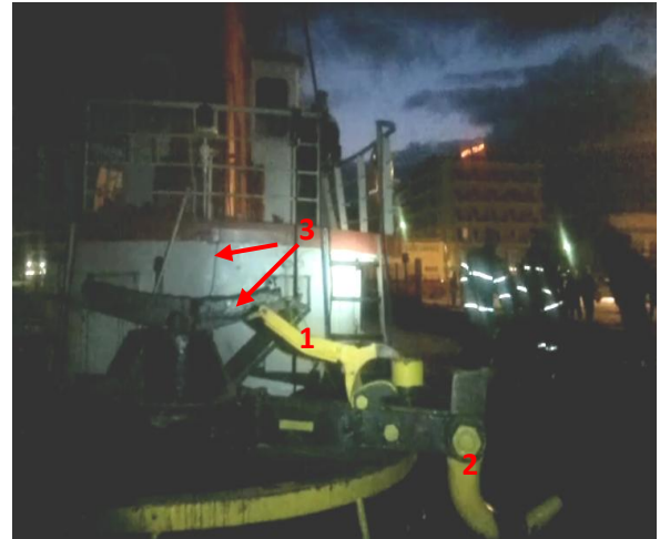
Εικόνα 3: Η διάταξη άμεσης απελευθέρωσης του άγκιστρου ρυμούλκησης του Ρ/Κ «ΑΡΤΕΜΙΣ V». Έχει αποτυπωθεί η κατάσταση πριν (αριστερά) και μετά (δεξιά) την απελευθέρωση. Διακρίνονται: 1: Βραχίονας ασφάλισης άγκιστρου, 2: Άγκιστρο ρυμούλκησης, 3: Συρματόσχοινο απασφάλισης, από το βραχίονα προς το χώρο πηδαλιουχίας.