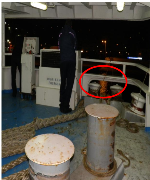
Εικόνα 3: Άποψη του πρυμναίου αριστερού χώρου του καταστρώματος πρόσδεσης. Επισημαίνονται (κυκλωμένοι με ερυθρό χρώμα) οι τονοδηγοί μέσω των οποίων διερχόταν ο πρυμναίος κάβος, στο σημείο όπου τραυματίστηκε ο ναύτης του πλοίου

Επί του εξεταζόμενου ναυτικού ατυχήματος, οι ανωτέρω περιγραφόμενες καταστάσεις δεν εκτιμήθηκαν επαρκώς, με αποτέλεσμα η ενέργειά του ναύτη να περάσει το χέρι του ανάμεσα από τους κάβους για να συγκρατήσει το σχοινί ανακρέμασης του λάστιχου να οδηγήσει στην επέλευση του συμβάντος.