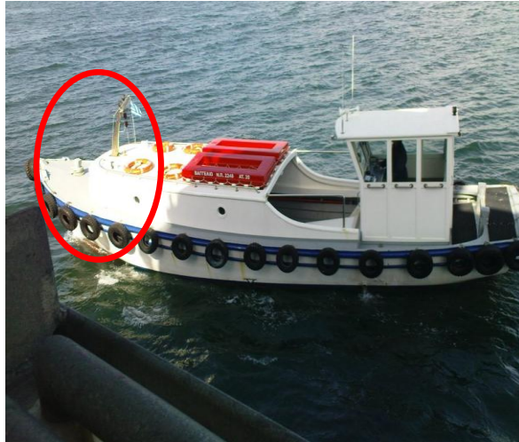
Εικόνα 1: Η Λάντζα «Βαγγελιώ». Έχει σημειωθεί (κόκκινη έλλειψη) το σημείο επιβίβασης των τριών ατόμων από το Δ/Ξ

Η επιβίβαση πραγματοποιήθηκε στην αριστερή πρωραία πλευρά της Λάντζας. Αρχικά επιβιβάστηκαν στην πλώρη της Λάντζας ο μηχανοδηγός, ο πλοηγός και εν συνεχεία ο μάγειρας του Δ/Ξ. Ο τελευταίος παρέλαβε από μέλος του πληρώματος του Δ/Ξ μία τσάντα με τα προσωπικά του είδη και μια βαλίτσα με τα ναυτιλιακά έγγραφα του πλοίου και στην προσπάθειά του να κατευθυνθεί με τις αποσκευές στην πρύμνη της Λάντζας, έχασε την ισορροπία του και έπεσε στη θάλασσα.