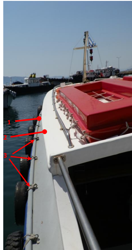
Εικόνα 2: Άποψη από την πρύμνη του αριστερού πλευρικού διαδρόμου της Ε/Γ – Λάντζας . Διακρίνονται:

Η διευκρίνιση προς τους κυβερνήτες των Ε/Γ-Λαντζών ότι η παραλαβή αποσκευών ή κάθε είδους εξοπλισμού ή αντικειμένων από πλοία, δέον είναι όπως χαρακτηρίζεται ως ξεχωριστή διαδικασία από αυτήν της επιβίβασης ατόμων και να πραγματοποιείται εφόσον οι καιρικές συνθήκες το επιτρέπουν με γνώμονα κυρίως την ασφάλεια του πληρώματος και των επιβαινόντων.